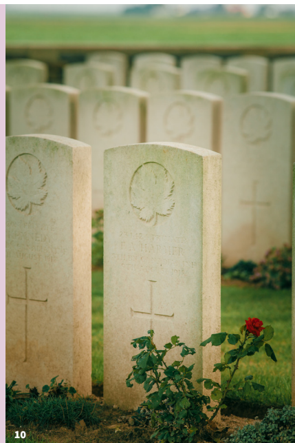
10. Cimetière Britannique